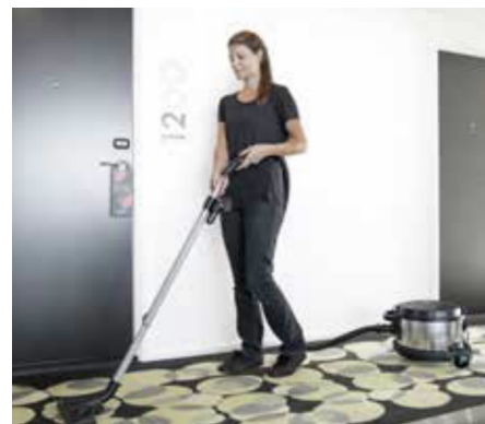
VP930 är specialkonstruerad för bullerkänsliga miljöer med lågt bakgrunds ljud, med en ljudnivå på bara 53 dB(A)