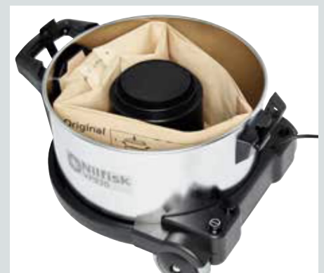
Hållbar stålbehållare och dammsugarpåse på 15 liter