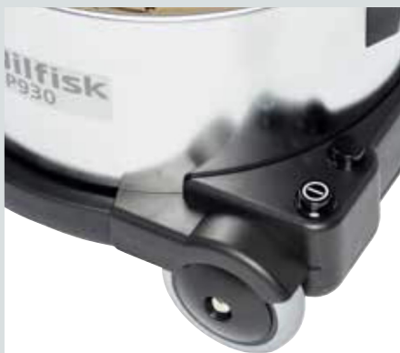
Utvalda modeller har dubbla hastigheter