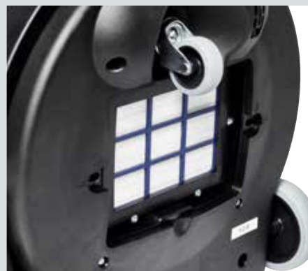
HEPA13-utblåsfilter för toppklassad ifttrering samtidigt som man bibehåller en hög luftkvalitet i området som rengörs