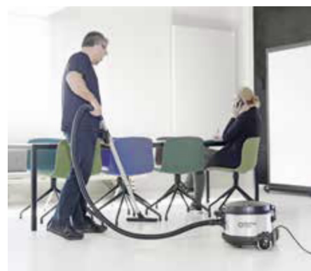
VP930 är det perfekta valet för krävande rengöring av t.ex. kontor, hotell och offentliga byggnader