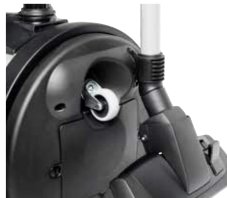
Parkeringslösning som standard